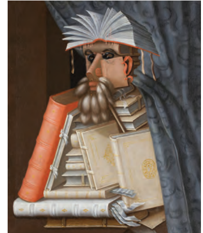
Giuseppe Arcimboldo, Bibliotecarul , 1566

5. Deși se numește Romanul adolescentului miop , narațiunea este declarată jurnal de naratorul ei. În câteva rânduri, acesta se gândește să scrie un roman cu titlul menționat, își face planuri, dar până la urmă nu reușește. Care credeți că este mai specifică vârstei, scrierea unui jurnal sau a unui roman? De ce?